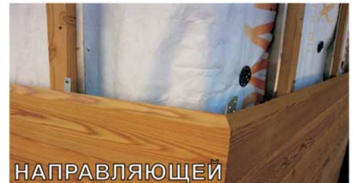
ЗАКРЕПИТЬ САМОРЕЗОМ КОНЕЦ ЗМЕЙКИ НА НАПРАВЛЯЮЩЕЙ

Между террасными / фасадными досками обязательно оставляйте промежуток 5-8 мм, ширина которого зависит от типа используемой древесины и ширины доски.