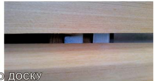
ПОДВОД КРЕПЕЖА ПОД ПРЕДЫДУЩУЮ ДОСКУ

При установке планкена на угол здания - на фасад одновременно подымается не одна доска, а сразу две угловые, предварительно соединенные на земле уголком. ⇨